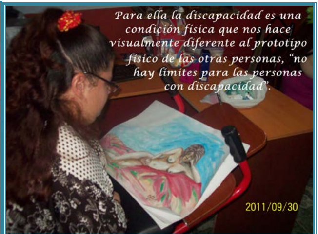
Para ella la discapacidad es una condición física que nos hace visualmente diferente al prototipo físico de las otras personas, "no hay límites para las personas con discapacidad".