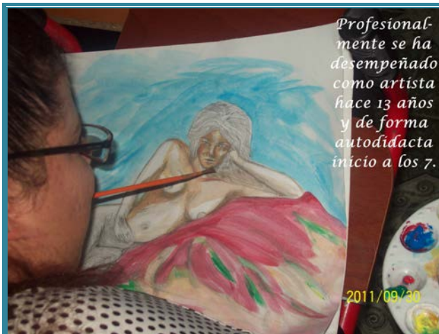
Profesionalmente se ha desempeñado como artista hace 13 años y de forma autodidacta inició a los 7.